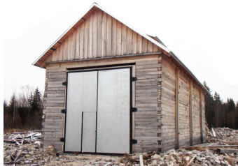
пождепо в д.Бурачиха

В начальный период становления добровольной пожарной охраны в Архангельской области (2012-2013 г.г.) в соответствии с требованиями принятого в 2001 году Федерального закона № 100-ФЗ «О добровольной пожарной охране» основное внимание было уделено разработке нормативной базы, определению мест размещения подразделений добровольной пожарной охраны, заключению договорных отношений с муниципальными образованиями и добровольцами, оснащению их пожарно-техническим имуществом. Проведенные мероприятия позволили доказать востребованность пожарного добровольчества и практическую возможность обеспечения пожарной безопасности сельских населенных пунктов силами добровольной пожарной охраны. Период 2014 года характеризуется повышением качества организации работы ранее созданных подразделений ДПО. В ходе проводимых комиссионных проверок с участием «ДПК ВДПО Архангельской области» и агентства ГПС и ГЗ Архангельской области проверялись: наличие и техническое состояние выделенных помещений, техническое состояние пожарной техники и вооружения, наличие муниципальных норма-