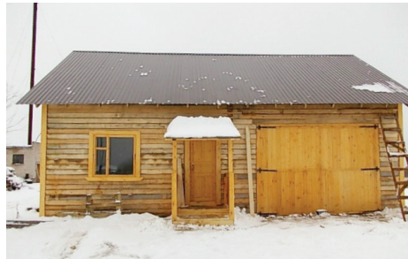
пождепо в д.Ширяха

волили администрации сельского поселения обратиться в агентство ГПС и ГЗ Архангельской области с предложением открыть на базе территориального подразделения добровольной пожарной охраны штатное подразделение противопожарной службы области с усилением штатного личного состава добровольцами.