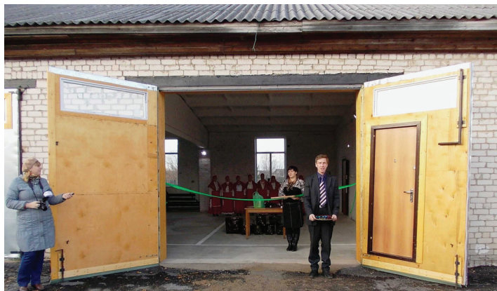
пожарное депо в д.Чащинская

• Каргопольский район, МО «Ошевенское», д. Ширяха – заканчиваются отделочные работы в новом благоустроенном здании добровольной пожарной части на один автомобиль и набором по-